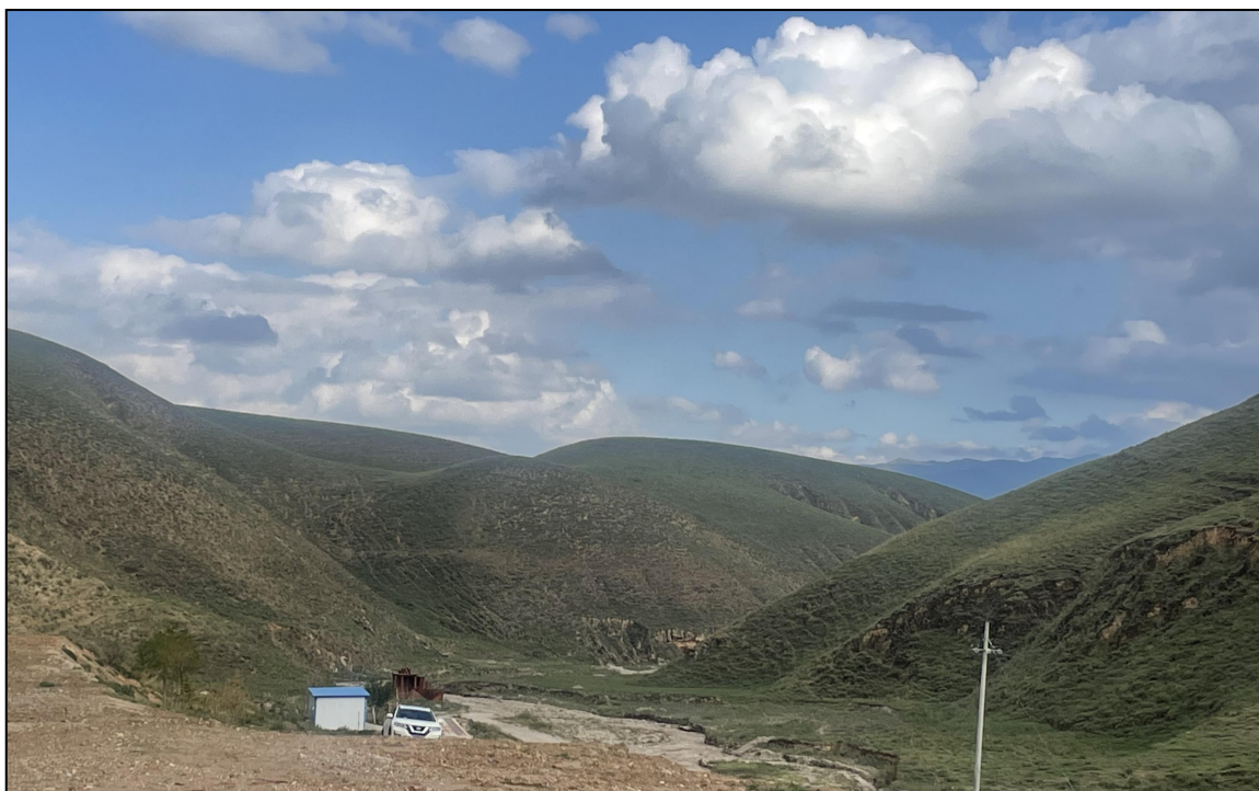
图 1-2 核实区地貌特征 镜向东南

核实区属中山-高中山地貌，地处宁南黄土丘陵，西华山腹地，海拔标高2000~2075m。核实区及周边地表多为薄层第四系松散沉积物覆盖，冲沟比较发育，多见沟壑、坳谷、洼地，见图 1-2。